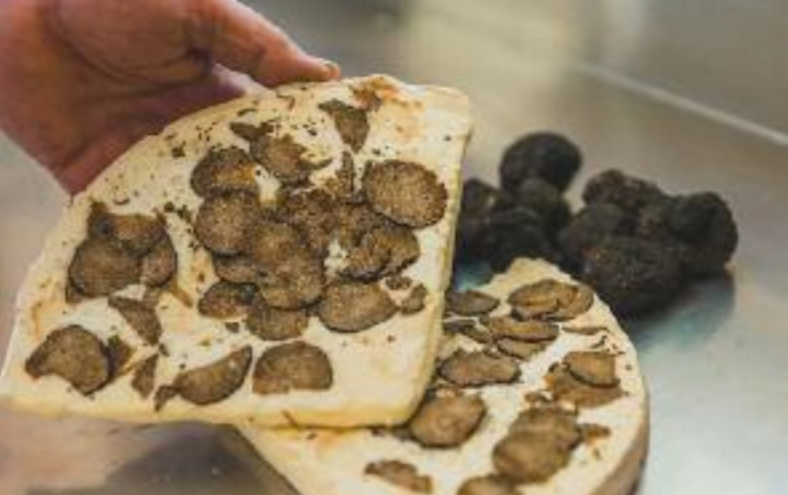
So schön kann der kulinarische Herbst sein: Brie-Käse mit Trüffel.