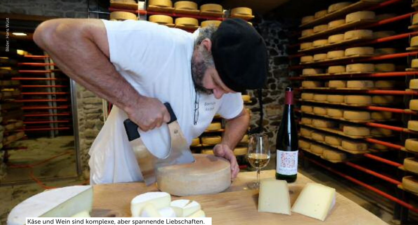
Käse und Wein sind komplexe, aber spannende Liebschaften.