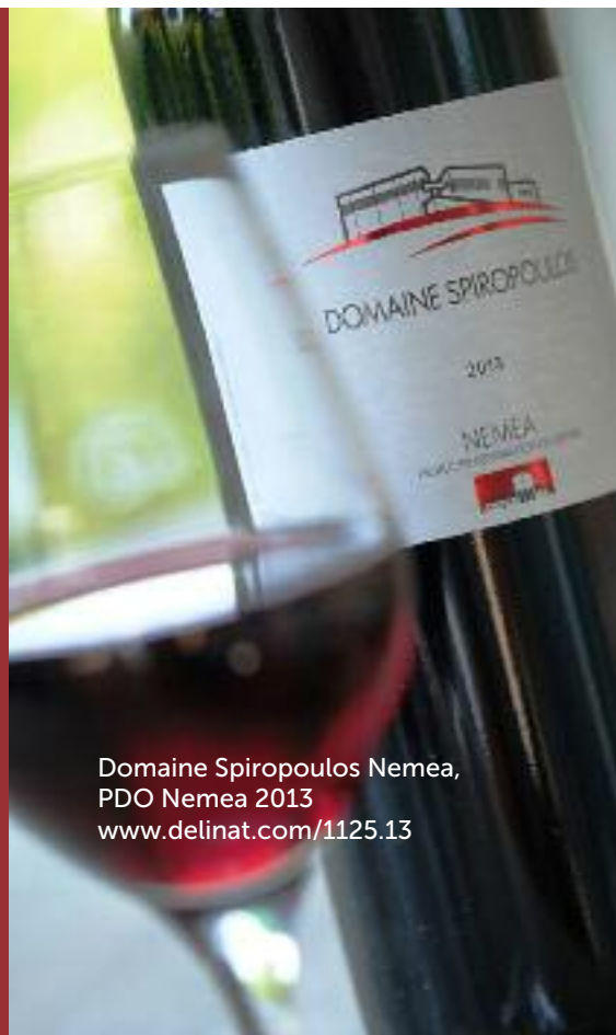
Domaine Spiropoulos Nemea, PDO Nemea 2013 www.delinat.com/1125.13