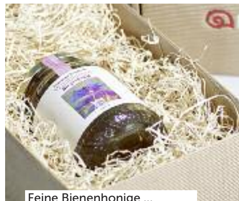
Feine Bienenhonige ...