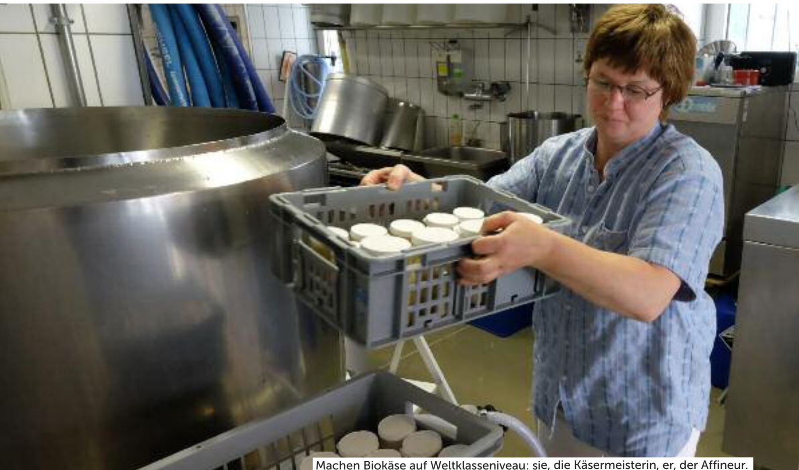
Machen Biokäse auf Weltklasseniveau: sie, die Käsermeisterin, er, der Affineur.