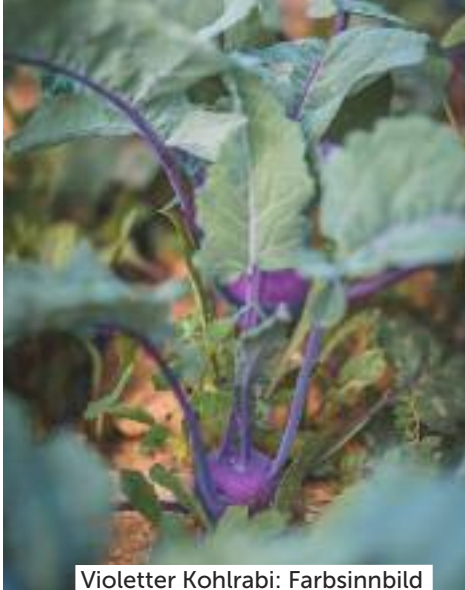
Violetter Kohlrabi: Farbsinnbild für den Advent.

sorten, Auberginen, allerlei Paprika und Knoblauch, Kartoffeln, rote, weisse und gelbe Zwiebeln, Schalotten, Erbsen und Bohnen, na ja, und Kräuter sowieso.» Natürlich muss hier bewässert werden, sonst würde das Gemüse die sommerliche Gluthitze nicht überstehen. Daher hat er auch einige Tomatenstöcke zwischen die schattigen Reben des Forschungsfelds gepflanzt.