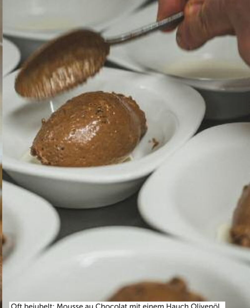
Oft bejubelt: Mousse au Chocolat mit einem Hauch Olivenöl.

Schokoladenbasis passen besonders gut zur vielschichtigen Aromatik von reifen roten Früchten, Rosinen und Kakao, zu den feingeschliffenen und dezenten Gerbstoffen und zur herrlichen Süsse dieses Dessertweins.»