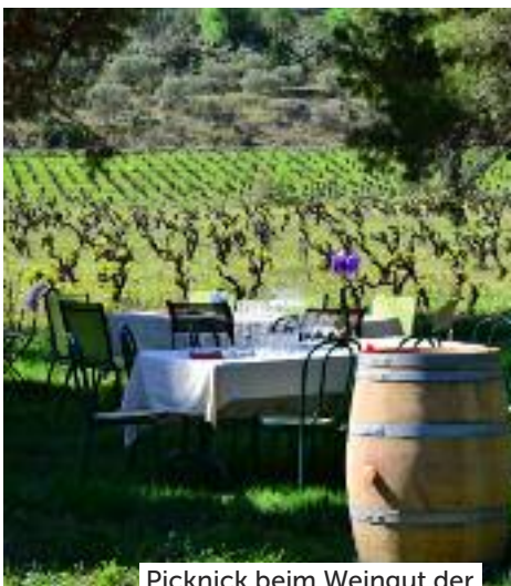
Picknick beim Weingut der Familie Lignères.