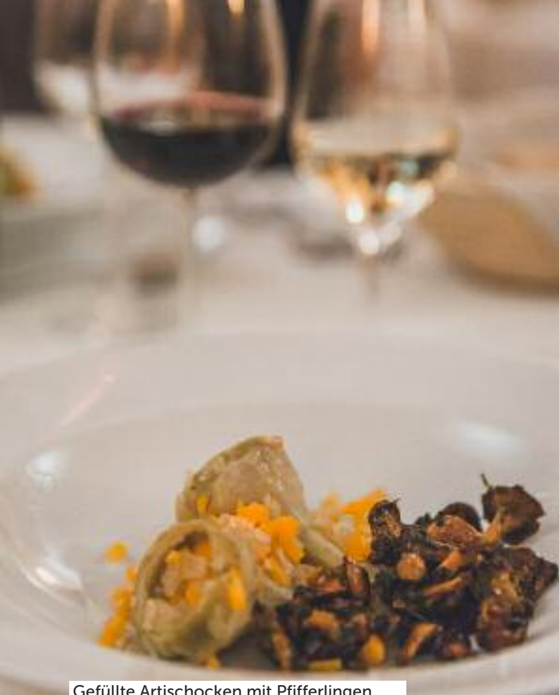
Gefüllte Artischocken mit Pfifferlingen.