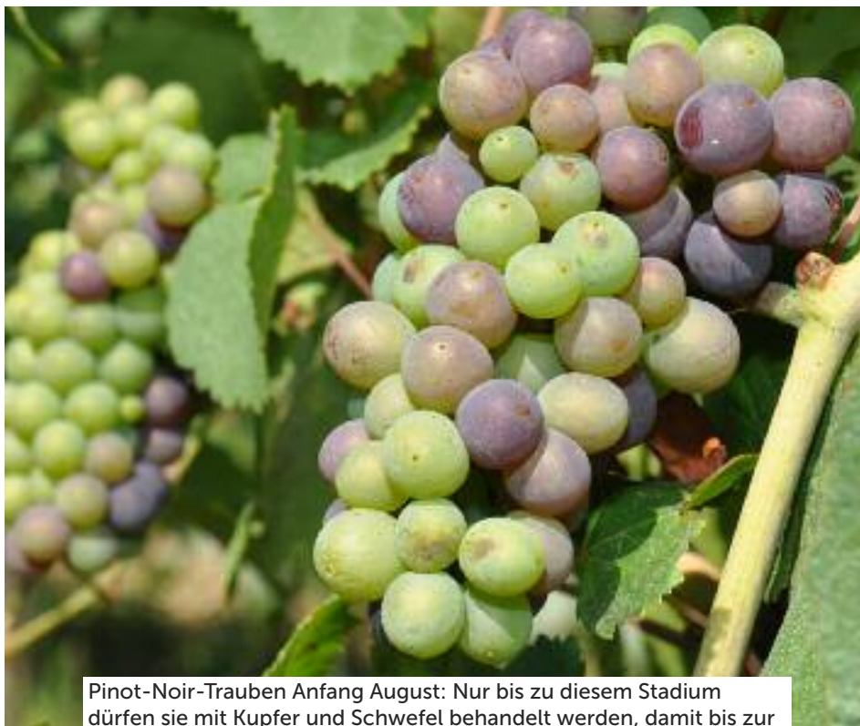
Pinot-Noir-Trauben Anfang August: Nur bis zu diesem Stadium dürfen sie mit Kupfer und Schwefel behandelt werden, damit bis zur Ernte keine Rückstände mehr auf den Trauben vorhanden sind.