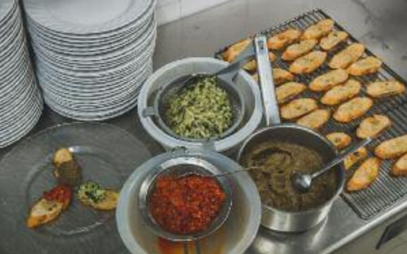
Frische Produkte und eine gute Vorbereitung sind die Basis für ein gelungenes Festmahl.