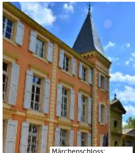
Märchenschloss: Château de Roquelune.