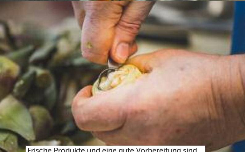
Einfach und doch speziell: Jakobsmuscheln an Kräuterschaum.